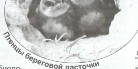
Птенцы береговой ласточки

- Это как в биологии, если одна популяция увеличивается, другая уменьшается, появляется паразитизм, хищнические явления. Но это только одна сторона. Часто мы губим живое, даже не замечая этого. К примеру, Зайсанская котловина, или "страна Жаворония", как я называл ее в одной из книг. Небо здесь гудело и зве-