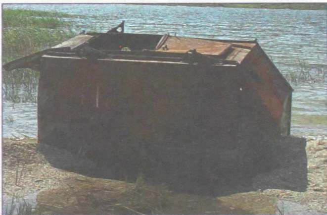
Ржавый бак для мусора - единственный на побережье