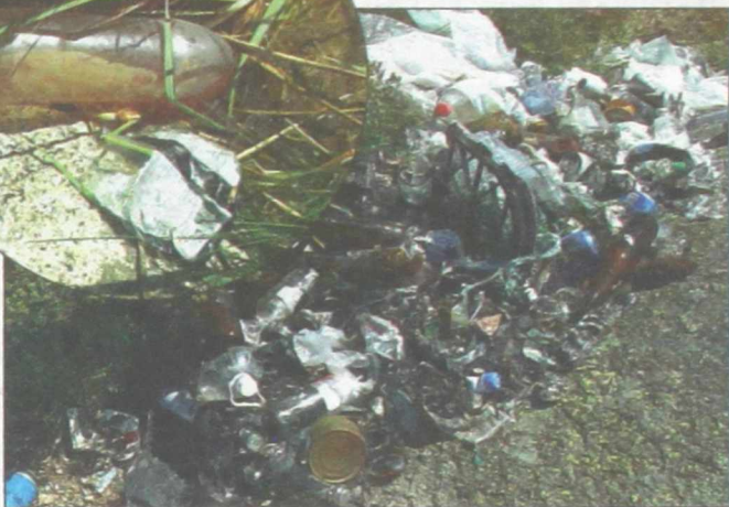
Берег озера утопает в мусоре