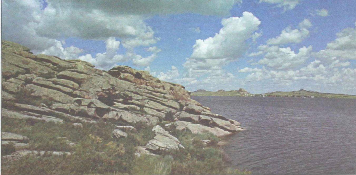
Красоты Дубыгалинского озера поражают

РЕЙД Общественники проверили популярное место отдыха ВКО