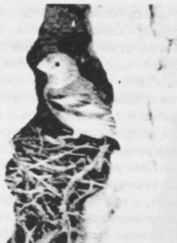
Монгольский снегирь на гнезде

Час и другой по щелям бродишь, по закоулкам, взойдешь на обрыв или холм и, несмотря на усталость, на привыкание к ярким краскам, желание открывать для себя «Марсианскую долину» у Зайсана, не пропадет, не иссякает. Ходишь и ловишь объективом экзотические уголки фантастической панорамы. Поражают, не меньше, красотой и уродством выживающие среди безводья и зноя растения – суккуленты, и всюду рассыпанные ожелезненные конкреции. Однако и здесь, по истечению нескольких часов, утомляешься: незаметно наваливается усталость от ослепляющего солнца и не замечаешь, как скоро наступает лёгкое разочарование – тайна «звездности», пропадает. Так вот быстро, оказывается, утомляют нас восторг и эмоции. И вспоминаешь тогда: эти самые глины Киин-Кириш в переводе с казахского, означают не что иное как: «трудный», «красивый». И потому, так хочется