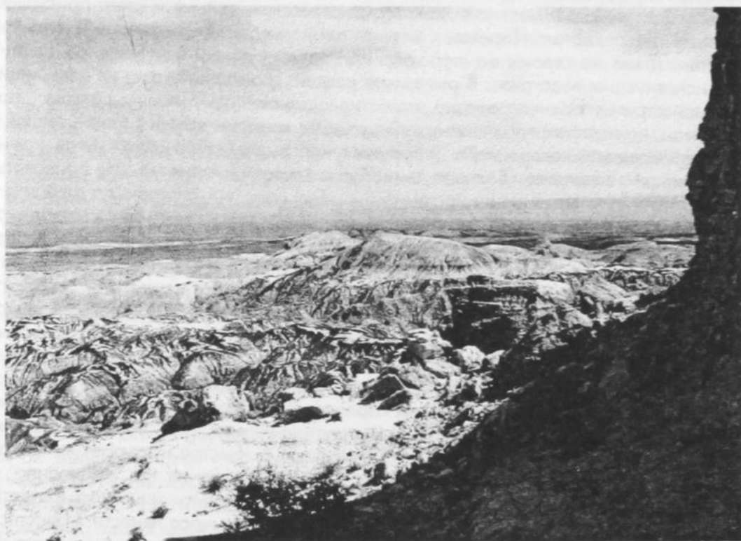
«Горные хребты» Киин-Кириш