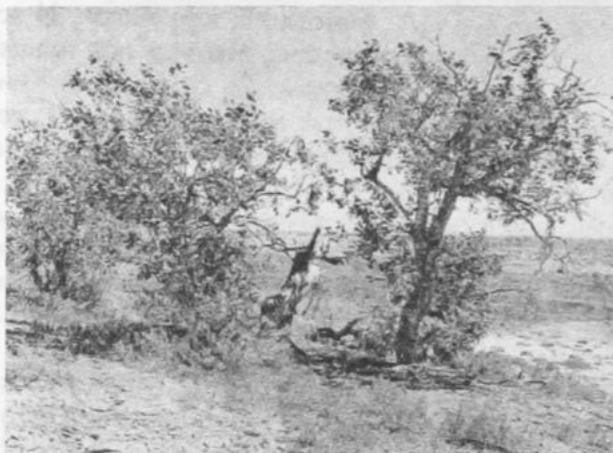
Остатки туранговых рощ

Полуденное солнце беспощадно: то здесь, то там на бескрайних просторах возрождаются миражи и, как в кривом зеркале, по мере нашего приближения к глинам, расплывались и отступали. Утопая в потоках горячего воздуха, красные сопки тряслись, меняя очертания и цветность. Это и был необычный у Озера звенящих колоколов, «инопланетный» пейзаж. Но, по мере приближения, краски холмов, вспышки огней на них мертвели и представлялась совершенно чуждая пониманию