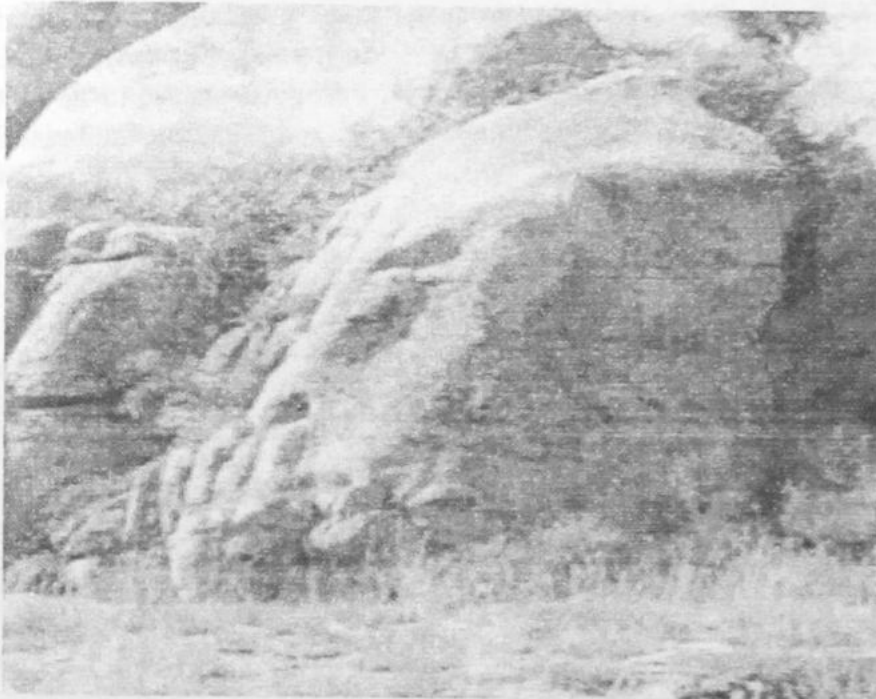
ЛИК БОЖЬЕЙ МАТЕРИ, ОБРАЩЕННЫЙ К ВОСТОКУ